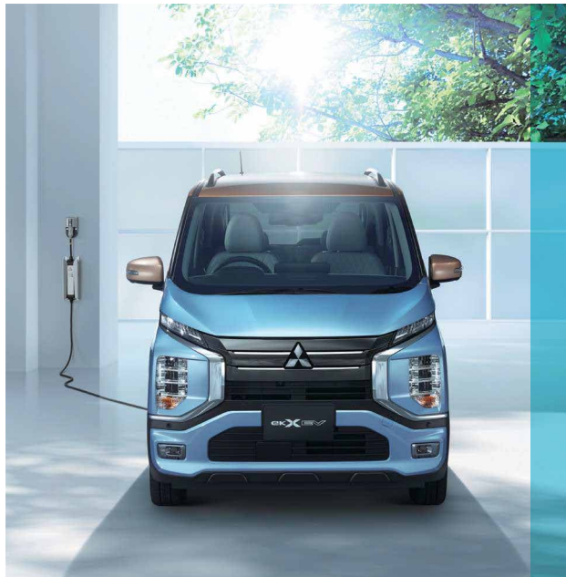
PHOTO:P ボディカラー:ミストブルーパール/カッパーメタリック(有料色) ●先進安全快適パッケージ、プレミアムインテリアパッケージ、ルーフレールはメーカーオプション ●画像はイメージです。右記表示のご利用料に有料色、オプション・付属品類は含まれません。